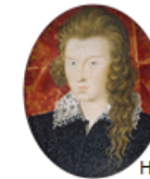
Henry Wriothesley, 3. Earl of Southampton